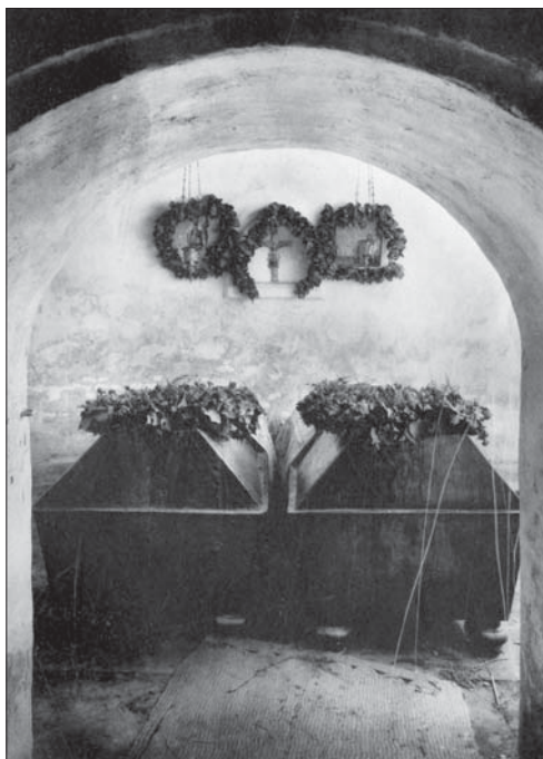
Усыпальница князей Дмитрия и Александра Голицыных (не сохранилась). Фото 1900-х гг.

воздвигнувшему себе памятник — Московскую Голицынскую больницу» 46 , явно недооценивали труды его брата.