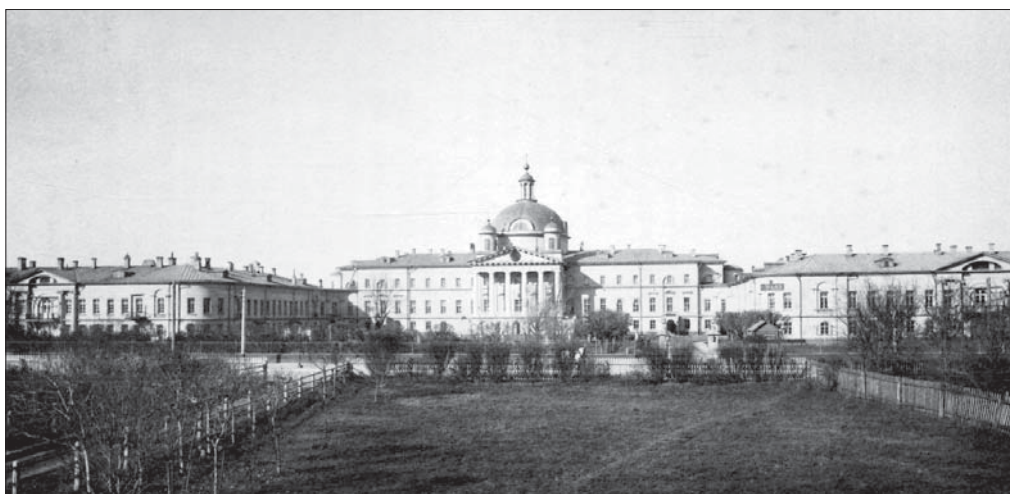
Голицынская больница Вид со стороны Большой Калужской улицы. Фото 1900-х гг. 2

Такой подход к историческим памятникам характерен для исследовательской литературы советского периода.