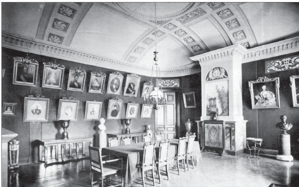
Зал для конференций при храме св. Благоверного Царевича Димитрия. Фото 1900-х гг.

нижать правление и личность Екатерины II 30 . Для Кэтрин Вильмот князь Александр Михайлович — «надменный разукрашенный фантом», сохранивший «все свои ордена, звезды и знаки отличия, которые, вдобавок к девяти десяткам лет, сгибают его вдвое. На нем бриллиантовый ключ, лавровая ветвь, украшения и блестящие безделушки — недаром он пользуется уважением своих сотоварищей-привидений, которые делили с ним государственные почести» 31 . Старики платили той же монетой, осуждая современные нравы, манеры и моды.