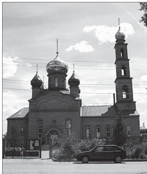
Воссозданный храм Рождества Богородицы в станице Орловской