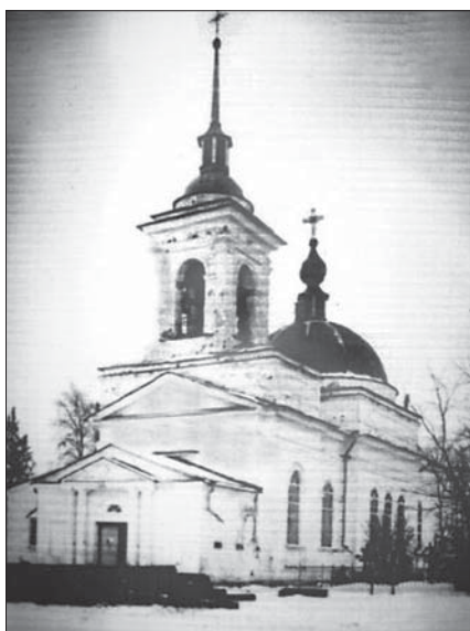
Храм Всех святых на Кузнечевском (Вологодском) кладбище. Старое фото

сто, выразительно и профессионально. На репетициях она была бескомпромиссной, хотя в душе и в жизни была по-христиански милосердна и прощала всем любое злое слово и дело.