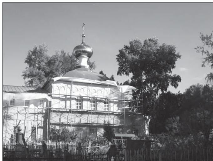
Свято-Ильинский храм, 2014 г.