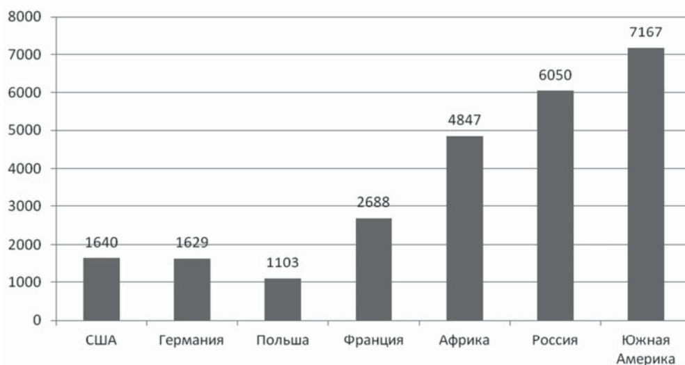
Диаграмма 2. Количество мирян на одного священника (данные 2011 г.) 79

ходские формы служения. Религиозная ситуация в России далека от европейской или американской. Однако простое соображение о схожести места, занимаемого священником в католицизме и православии, вызывает желание сопоставить их количество в соотношении с прихожанами. Временная нагрузка на католического и православного священника при совершении таинств не одинаковая, но сходная. Сопоставление количества мирян на одного священника в католических странах и в России, представленное в диаграмме 2, заставляет задуматься о возможных проблемах в современной церковной жизни в России, связанных с труднодоступностью священника.