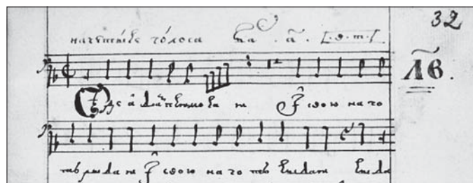
Ил. 2. Сборник партесных композиций. ОР БАН. Тек. пост. 16.9.25. Л. 32

Второй из источников, указанных выше, — рукопись ОР БАН, Собрание текущих поступлений, № 16.9.25, партия баса. Сборник включает в себя Вечерни, Задостойники, концерты (всего по нумерации 53 сочинения), в том числе Н. Дилецкого и В. Титова. На л. 32 имеется запись: «На четыре голоса Бас Т. В. Т.», где инициалы указывают на авторство Титова: