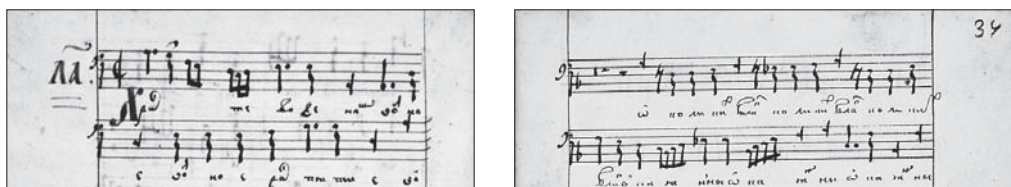
Ил. 3. Сборник партесных композиций. ОР БАН. Тек. пост. 16.9.25. Л. 29 об., 34

Под этой записью помещен концерт «Седе Адам», отсутствующий в рукописи Тихомирова, но идущий вторым номером в Син. певч. 860. За ним следуют концерт «О коликих благ», атрибутированный Титову в Тих. 503, и концерт «Пастырская свирель» (в Тих. 503 анонимный, а в Син. певч. 860 идущий под четвертым номером). Интересно, что именно в записи этих трех сочинений (л. 32–36) наблюдается другой почерк. Если большая часть рукописи написана аккуратным, «размеренным» и более «чистовым» почерком, то запись этих концертов выполнена почерком более «скорописным», тонким по нажиму, мелким в фиксации квадратной киевской нотации и подтекстовки, отличается своеобразной размашистостью заглавных букв и нижних росчерков. Это различие можно увидеть в следующих иллюстрациях: