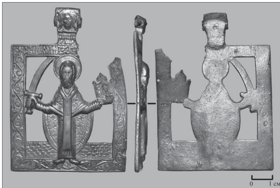
Ил. 3. Прорезная икона «Николай Можайский»

верхней части рамки имеется надпись «Святой Николай Можайский», ступни святого находятся на нижней части рамки.