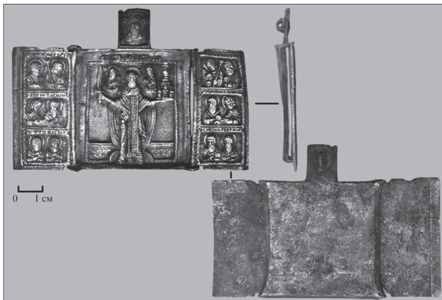
Ил. 2. Малый трехчастный створ «Николай Можайский. Избранные святые»