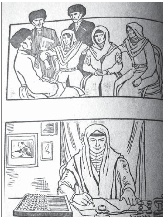
Рис. 5. Первая книга по русскому языку для горских школ «Красный горец», 1932. С. 16

Идеальная структура. Визуальная структура идей — не менее сложный объект для анализа, чем нормативная, и во многом схожа с ней по визуальным образам. Особенность раннесоветских букварей в том, что изображаемые идеальные образы были полярные, без полутонов: «правильная» (советская, атеистическая) и «неправильная» (буржуазная, религиозная) идеи. На картинках букваря «В бой за грамоту» немало изображений плакатов и лозунгов, конституировавших приоритет грамотности и образования — «Все за грамоту», «За всеобуч» и т. д. В другом букваре группа школьни-