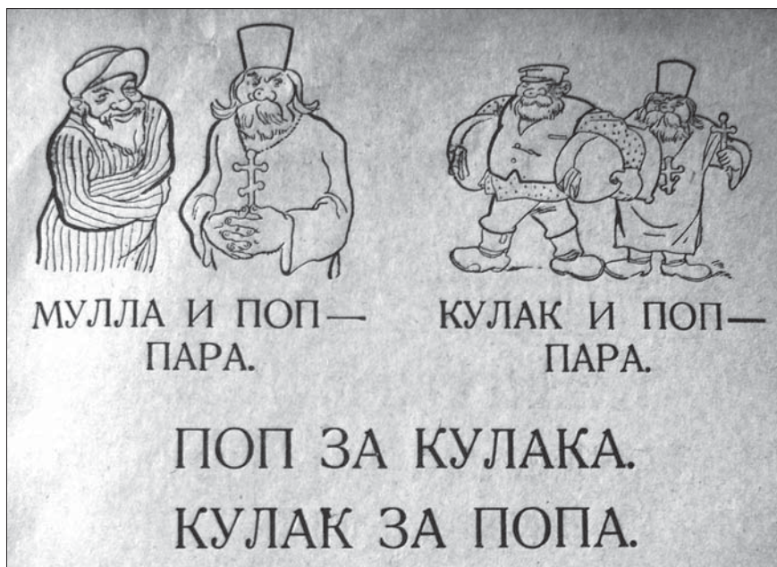
Рис. 6. Букварь для сельских школ «В бой за грамоту», 1932. С. 17

Структура возможностей. Анализ структуры возможностей связан с изучением общественных контрастов вроде имущественного неравенства. На первый