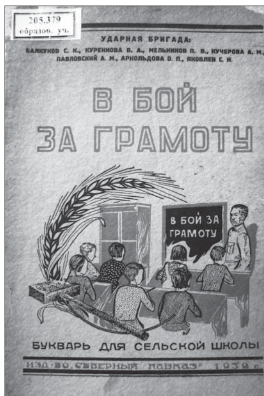
Рис. 4. Обложка букваря для сельских школ «В бой за грамоту»

Интеракция. Данные буквари содержат разнообразный визуальный материал, репрезентирующий ученику символическое изображение «советскости». В отличие от букварей конца 1920-х, в учебниках 1932 г. визуальная интеракция начинается с обложек двух изданий из трех. На обложке букваря «В бой за грамоту» изображена ситуация урока (рис. 4). Учитель во френче (типичный комиссар периода Гражданской войны) стоит у доски с надписью «В бой за грамоту» и пристальным взглядом смотрит на учеников. Школьники, изображенные со спины, послушно записывают за ним. Фигура учителя заметно возвышается над ребятами, подчеркивая его несомненный авторитет. Рисунок обрамляет стилизованная символика серпа (в виде изогнутого колоса) и молота. Обложка букваря «Октябрята» (рис. 1) изображает ситуацию дружного взаимодействия в группе сверстников: октябрюта готовятся к