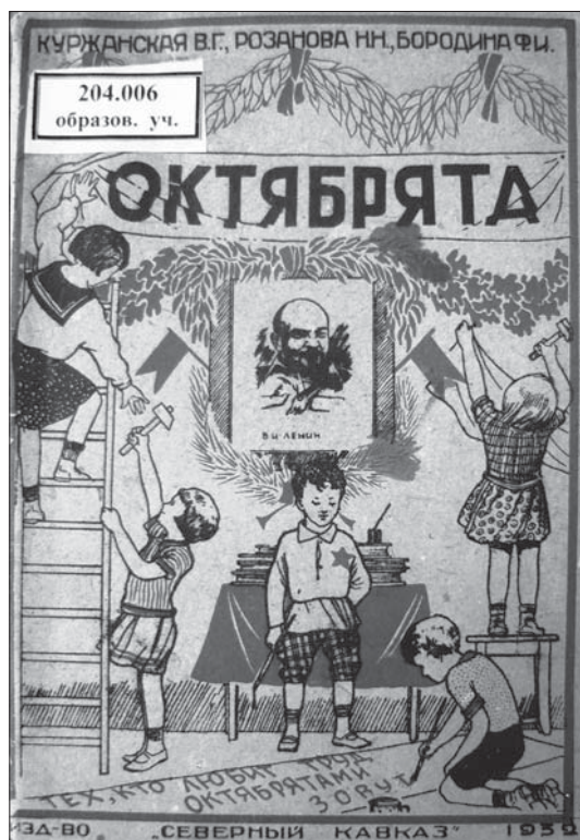
Рис. 1. Обложка букваря для городских школ «Октябрят»

Визуальные образы начинались с обложки букваря. В исследованных книгах почти все обложки (кроме «В школе и дома») были цветными. Это единственные цветные картинки в данных учебниках, с соответствующими для того периода невысокими характеристиками цветопередачи. Динамика репрезентации визуальных образов на обложке демонстрирует переход от мелких рисунков к крупным. Если в 1927 г. в букваре «И мы работаем» рисунок, размещенный в центре в кругу, занимал менее 13% площади обложки, а в букваре «Путь к грамоте» (1929) рисунок в нижней половине обложки занимал 26,5% её площади, то в двух букварях 1932 г. (за исключением книги «Красный горец») зона рисунка намного больше — 40% в букваре «В бой за грамоту» и 71% в «Октябрят».