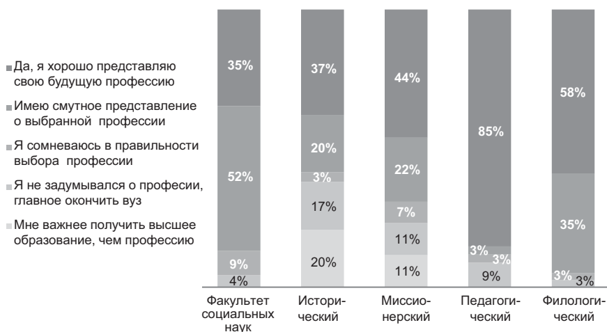
Рис. 3. Распределение ответов на вопрос: «Можете ли вы утверждать, что достаточно хорошо понимаете содержание своей будущей профессии?»

Какие выводы мы можем сделать? Лучше всего представляют свою профессию педагоги, что кажется очевидным. На филфаке и ФСН студенты, так или иначе, более других имеют представление о своей будущей профессии. Большинство тех, кто считает получение высшего образования важнее выбора профессии, – на истфаке. На Историческом факультете студенты более других считают, что получение высшего образования как такового важнее выбора конкретной профессии.