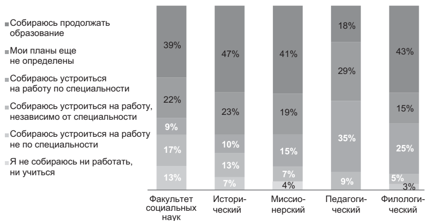
Рис. 4. Распределение ответов на вопрос: «Каковы ваши профессиональные планы после окончания вуза?»