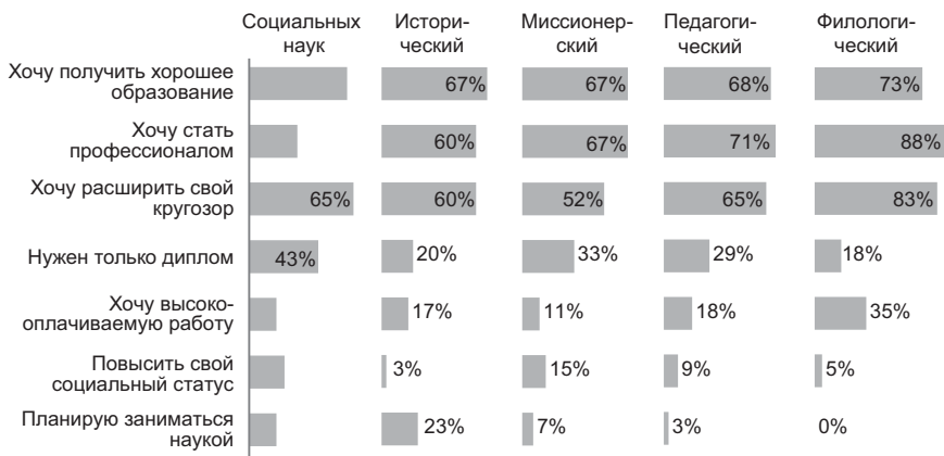
Рис. 1. Распределение ответов на вопрос: «Для чего вам нужно высшее образование?»

Первый вопрос – «Для чего вам нужно высшее образование?» (Рис. 1). И вот как распределились ответы на него: