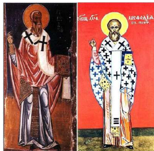
сщмч. Киприан Карфагенский

сщмч.Киприан Карфагенский (258г.). Фасций Цецилий Киприан, епископ Карфагенский, мученически пострадавший в правление императора Валериана в 258 году, всей своей жизнью и впоследствии мученической кончиной явил воистину верное и мужественное свидетельство о Христе. Еще во время своего оглашения Киприан согласно житию, принял на себя обет безбрачия, продал свое имение, а вырученные за него деньги раздал нищим. Через 2 года после крещения был избран епископом 1 . Будучи глубоко просвещенным мужем, св. Киприан, был убедительным провозвестником Учения Христова. Сщмч. Киприан самым делом научает свою паству мужественному исповеданию. Служение свт. Киприана приходится на непростой период в истории Церкви - на гонение императора Декия в 250 году, которое было воздвигнуто на Церковь после почти двадцати лет терпимости. Тогда после столь продолжительного мира, Церковь стала наиболее уязвима к испытаниям. Сам свт. Киприан приходит к выводу, что «Продолжительный мир повредил учение, преданное