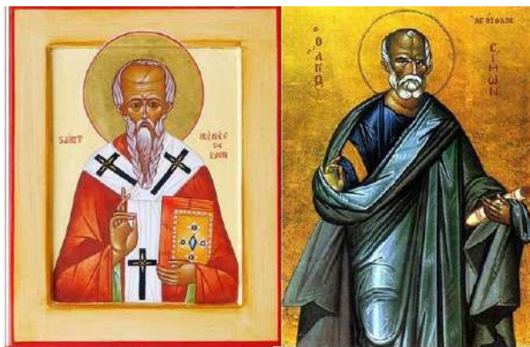
сщмч. Ириней Лионский

что о подвиге мученичества заранее предвозвестил Христос, как о «страдании, которому должен был подвергнуться сперва Он Сам, а потом ученики Его» (кн.4, гл.8:5). св. Ириней изъясняет еретикам, что именно о таком кресте говорит Христос: «Если кто хочет идти